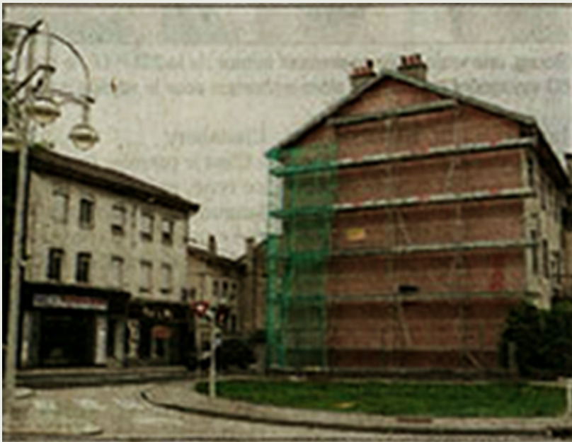
Des échafaudages ont été déjà installés afin de procéder à une reprise de la façade