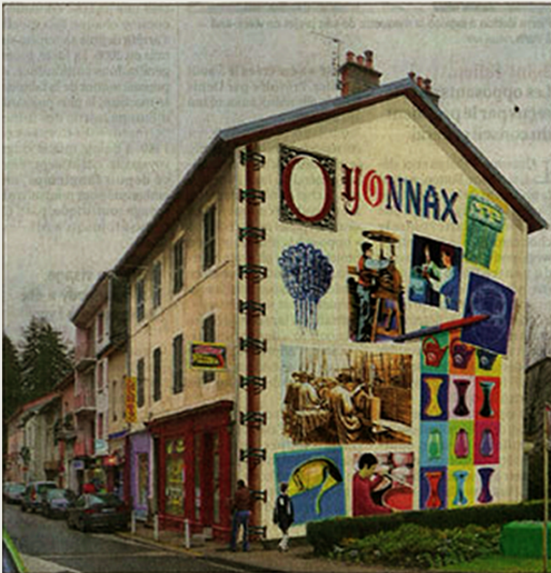
Intégré dans le paysage, le projet de fresque qui sera prochainement réalisé par les artistes de CitéCréation