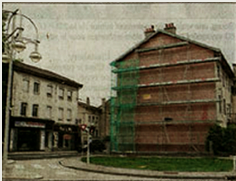
Os andaimes já foram instalados afm de proceder a preparação da fachada para o futuro afresco